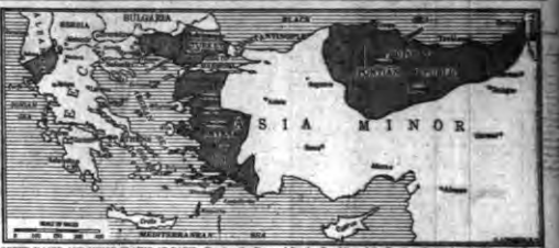
GREEK CLAIM AND GREEK CLAIMS AT PARIS—Showing the Proposed Greek Republic and the Territory Sought in Asia Minor and Epirus.