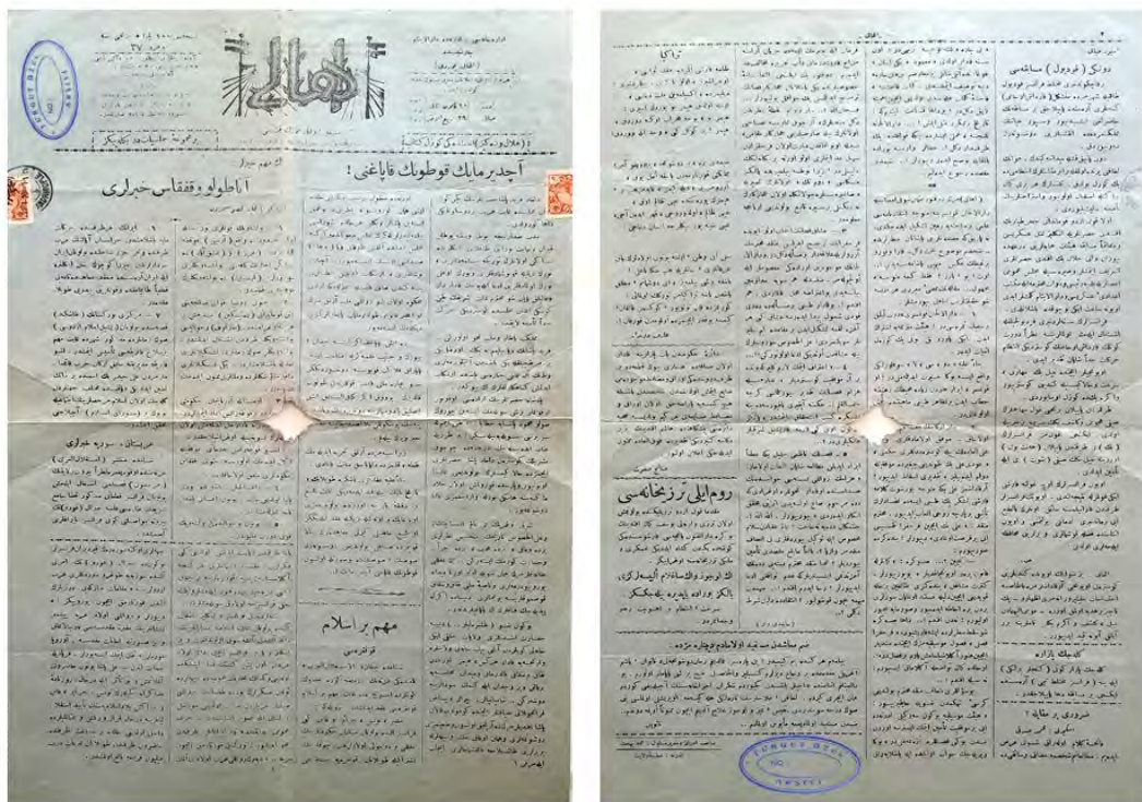
EK 8: Temin, 2 Haziran 1921 (8 Şevval 339), Numara 264, eksik 1. sayfa (Turgut Özel Arşivi)