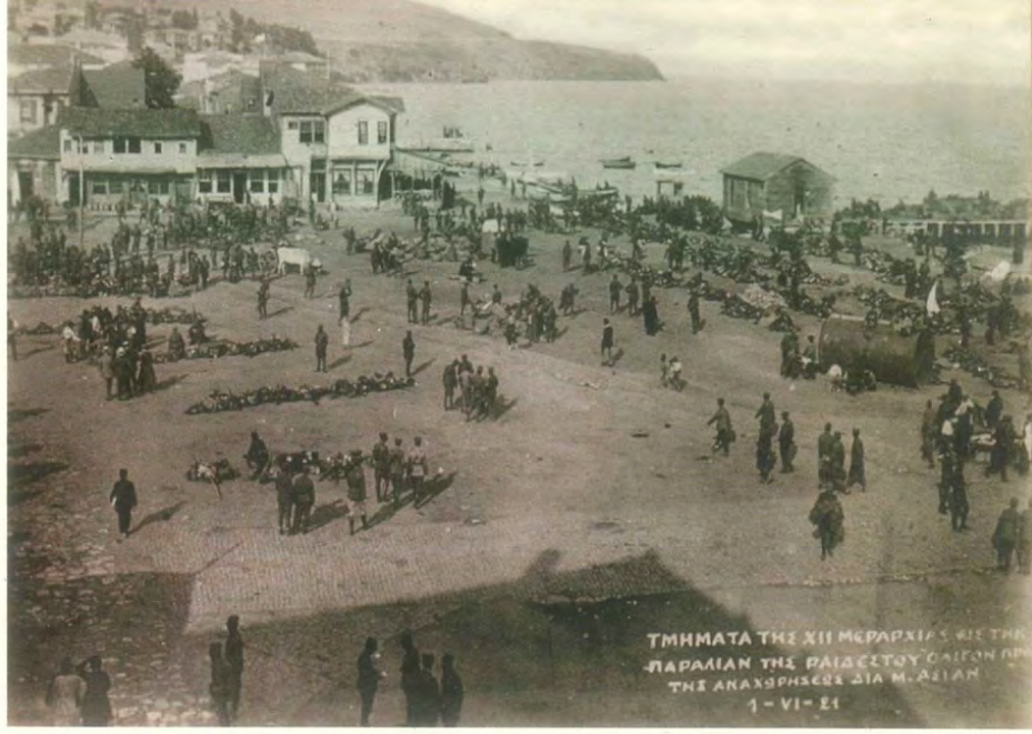
(Anadolu'ya sevk edilmek üzere Tekirdağ sahilinden gemilere bindirilmek için bekleyen Yunan askerleri.)