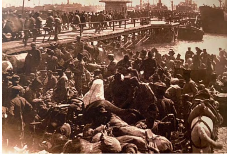
3.Kolordu Birliklerinin 5 Eylül 1922'de Tekirdağ Limanından Karaya Çıkışları (Dimitris A. Mavridis, İstanbul'dan Tekirdağ'a Çağdaş Yunan Kimliğinin Arayışında, Tekirdağ: Tekirdağ Belediyesi Yayınları, 2017, s. 130)

Yunan ordusunun Anadolu'da yenilmesiyle vapurlar Batı Anadolu sahillerinden binlerce göçmeni Tekirdağ'a nakletmiş, şehrin nüfusu artmıştı. 3. Kolordu bitkin ve yorgun düşmüş, 60 bin asker ile 80 bin Rum muhacir Eylül 1922'de Tekirdağ iskelesinden karaya çıkmışlardı 196 .