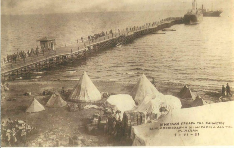
Anadolu'ya gitmek üzere yola çıkan ve ağırlıklarıyla Tekirdağ iskelesinde kamp kurmuş Yunan askerleri (Dimitris A. Mavridis, İstanbul'dan Tekirdağ'a Çağdaş Yunan Kimliğinin Arayışında, Tekirdağ: Tekirdağ Belediyesi Yayınları, 2017, s. 115.)

Yunanlılar 1921 yılı Temmuz'unda Gümölcine'deki bir fırka kuvveti Tekirdağ'a nakletmişlerdi. Kırkkilise'de bir alaya yakın kuvvetleri olduğu ve Gümölcine'nin bazı köyleri ileri gelenlerini darp ederek tutukladıkları, işkenceyle öldürdükleri duyulmuştu. Bütün bu saldırıların Fransızların Trakya'yı boşaltacakları ve buraları Türklere bırakacakları, silah ve zahirenin dışarıya ihracı gibi nedenlerle yapıldığı haber alınmıştı. 168