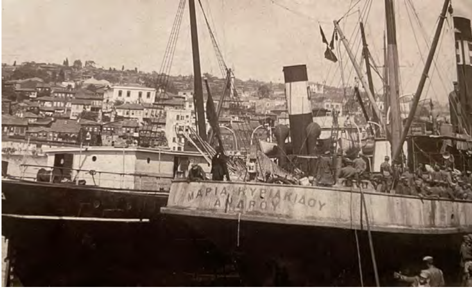
Yunan askerî birliklerinin Tekirdağ rıhtımından nakledilişleri. Kaynak: Dimitris A. Mavridis, İstanbul'dan Tekirdağ'a Çağdaş Yunan Kimliğinin Arayışında, Tekirdağ: Tekirdağ Belediyesi Yayınları, 2017, s. 118.)

12. Tümen, General Trikupis'in komutasında savaşmış, arta kalan birlikler 19 Ağustos 1922'de esir düşmüşlerdi. 173 1922 yılı Temmuz'unda 4. Kolordu'nun karargâh merkezi Tekirdağ oldu. 174 Bu dönemde Tekirdağ'daki Müslümanlara yönelik öldürme, yaralama, hapsedme ve gasp olayları arttı. Şark hattı kumandanı Yüzbaşı Şükrü'nün verdiği 10 Haziran 1922 tarihli rapora göre bölgedeki durum şöyleydi: