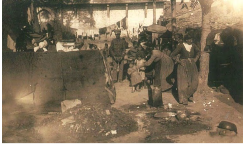
Anadolu'daki yenilginin ardından yollara düşen Rum muhacirler, 8 Eylül 1922, Tekirdağ. Dimitris A. Mavridis, İstanbul'dan Tekirdağ'a Çağdaş Yunan Kimliğinin Arayışında, Tekirdağ: Tekirdağ Belediyesi Yayınları, 2017, s. 131