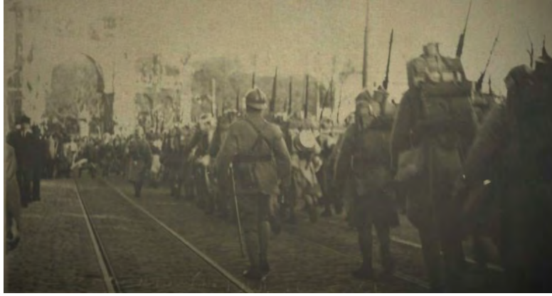
Trakya'yı işgale giden ilk Fransız askeri kıtası şimendifere giderken (TTK.OFS_14_65.)

kontrol etti ve ertesi gün bir Fransız birliğinin buraya geleceğini Osmanlı Hükûmeti'ne bildirdi. Hükûmet bu talebi mütareke gereği görerek kabul etti. 7 Kasım 1918'de bir Fransız askeri birliği Uzunköprü'ye geldi ve gelecek olan kuvvetler için barınma ve iâşe temini işlemlerine başladı. Osmanlı Hükûmeti, Fransız askerlerine iyi davranılmasını istiyordu. Uzunköprü'ye gelen Fransız askerlerinin tamamı burada kalmayarak bir kısmı İstanbul'a geçtiler. 55 6 Aralık 1918 tarihinde, Franchet d'Esperey'in ertesi gün öğleden sonra saat 15:00 ile 17:00 saatleri arasında Edirne'den geçeceği ve şehri ziyaret edeceği, dolayısıyla ona layık bir karşılama töreni yapılması vilayete bildirildi. 56