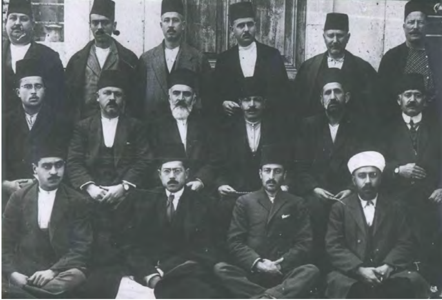
Edirne Yurtseverleri Girit Hanya Kasabasında ( TTK. TB. 151_73_1.)

1922 yılı Temmuz ayı itibariyle Doğu Trakya'da 40 bin hane Yunanlılar tarafından yakılıp yıkılmış, 75 bin kişi Atina, Girit ve adalardaki zindanlara sürülmüşlerdi. 330