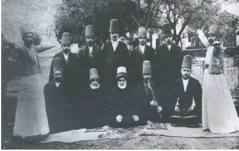
Girit Hanya Kasabasında Yurtsever Edirne Mevlevileri