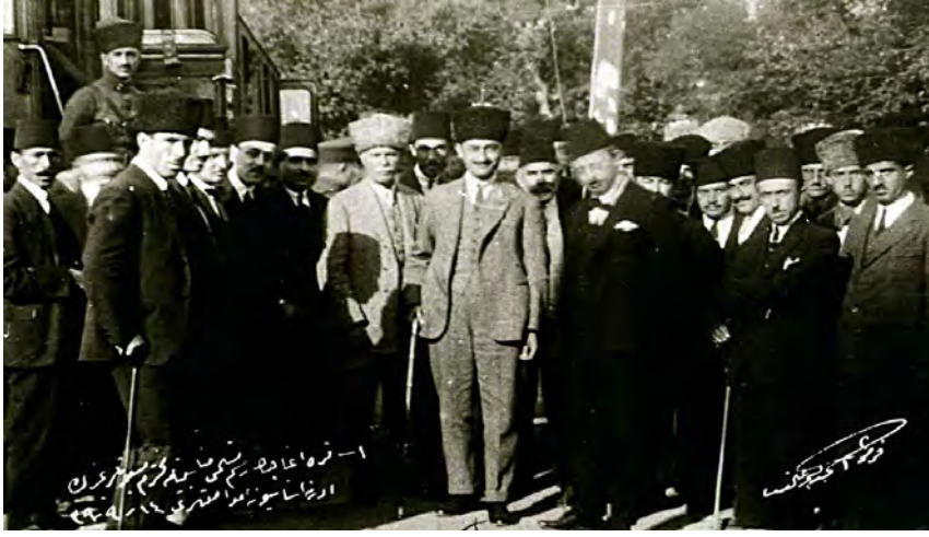
Karaağaç'ın tesliminde mebuslar -14.09.1923