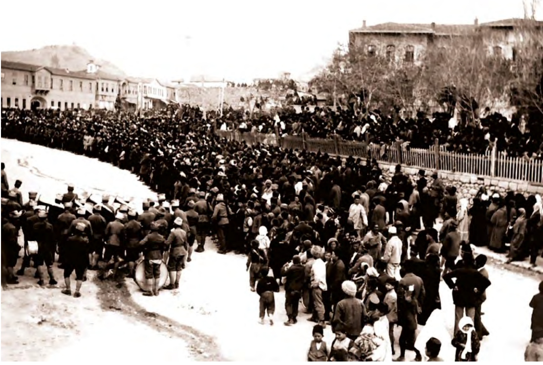
EK 1. Edirne'nin Yunanlar tarafından iřgali nedeniyle TBMM önünde yapılan miting, Ankara, 1920.