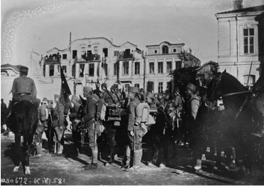
Türk askeri Edirne'de (1922)

Doğu Trakya'nın Türklere devir ve teslimi işiyle Refet Paşa'nın görevlendirildiği belirtilmişti. 19 Ekim'de Mudanya'dan hareket eden Refet Paşa, beraberindeki 100 jandarma ile saat 15.00'da İstanbul'a ulaştı. 401 Trakya'nın devir ve teslimi işini gerçekleştirmek üzere bölgeye jandarmalar gönderilmesi kararlaştırıldı. Refet Paşa 27 Ekim'de bölgeye gönderilecek birliklerin görevleri hakkında bir talimatname hazırladı. Emniyet ve asayişin sağlanması amacıyla Doğu Trakya'yı jandarma müfettişliklerine teslim etti. Trakya Jandarma Teşkilatı subay ve erlerle birlikte 10 bin 297 kişiye ulaşıyordu. Edirne Jandarma Müfettişliği Albay Mümtaz Bey'in kumandasına verildi. 9, 10, 11, 12 numaralı taburlar buraya bağlandı. Bağlı bölgeler; Yeni Mustafa Paşa, Lalapaşa, Uzunköprü, Dimetoka kazasının Meriç doğusunda bulunan kısmı ile Edirne olarak tespit edildi. 402