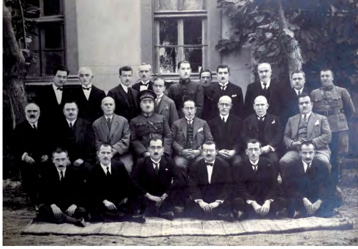
Kongredeki delegelerden bir kısmı

Kongrede silahlı millî müfrezelerin kurulması konusu ele alındı. Doğu Trakya'ya dışarıdan ve içeriden yapılacak saldırılara ve Barış Konferansı'nın bölgeyi Türklere kopardığı kararlarına karşı gelmek amacıyla Trakya Paşaeli Cemiyeti'nden ayrı Müdafaa-i Hukuk Heyet-i Muvakkatesi adıyla merkezde ve bağlı yerlerde bir örgütün kurulmasına karar verildi. Doğu Trakya'da bekçi-korucu ismi altında 3 bin kişilik bir millî teşkilat oluşturulması kararı alındı. Kongre kararına Doğu Trakya'nın her tarafındaki müdafaa-i hukuk teşkilatları uymadılar. Tekirdağ Müdafaa-i Hukuk Teşkilatı kendilerine düşen miktar olan 300 kişilik millî teşkilatın kurulmasına karşı çıktı.