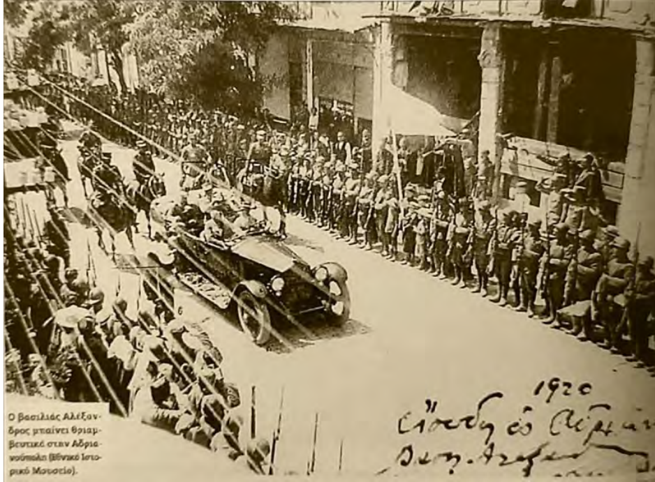
Yunan Kralı Edirne'de

Edirne'de Yunan işgal idaresi 26 Temmuz 1920'de Yunan kuvvetlerinin şehre girmesiyle başladı. Aynı gün öğleden sonra Yunan Kralı Aleksandros Edirne'ye girdi. 284 Kralın şehre girmesi Türkler ve Müslümanlar arasında büyük üzüntüyle karşılanırken, 285 Rumlar arasında büyük sevinç yarattı. İşgali Metropolithane'de yaptıkları büyük dinî tören ve ardından 21 pare top atışıyla kutladılar. 286