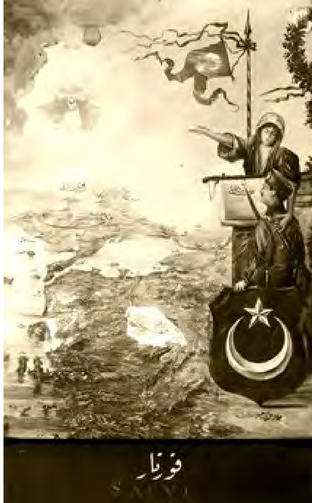
Kurtar ! (TİTE. FK39G67B67-900)