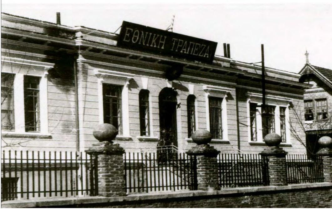
Yunan işgal döneminde millî banka olarak kullanılan İstiklal İlkokulu

Trakya Paşaeli Cemiyeti'nin fikrî karargâhı olan İstiklal İlkokulu, Edirne'nin işgali günlerinde Yunan Bankası olarak kullanıldı. 350