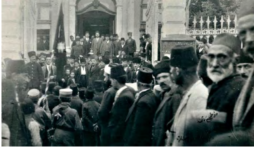
Edirne Belediyesi önünde kurtuluş sevinci

İstanbul Caddesi üzerinde bulunan Hahambaşılık binası lambalarla aydınlatılmıştı. Yahudi cemaati heyeti alkışlarla karşıladı. 24 Kasım'da düzenlenen törende hazır bulunan Hahambaşı protokol konuşmalarının ardından ilk sözü aldı ve Türk heyetine teşekkür etti. 409