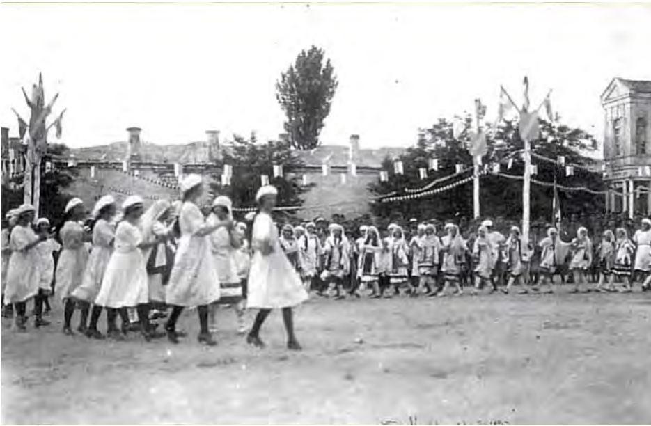
Edirne Valilik Binasında Rumlar kutlama yaparlarken

Bu arada 10 Ağustos 1920 tarihinde imzalanan Sevr Barış Antlaşması ile Doğu Trakya Yunanistan'a bırakıldı. Sevr Antlaşması 7 Eylül 1920'de Yunan Parlamentosu'nda onaylandı. Edirne'nin Yunanlılar tarafından işgali üzerine Osmanlı subay ve erlerinin Bulgaristan'a iltica ettiklerini belirtilmişti. İsveç Sefareti'nden gelen 21 Aralık 1920 tarihli yazıya göre, Bulgaristan'a iltica eden 300 subay ve 3 bin er, her biri 60 subay ve