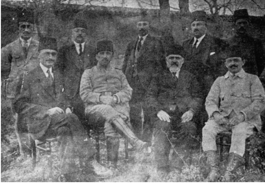
16 Ekim 1919 tarihli Edirne Kongresi'nde seçilen Trakya Müdafaa-i Hukuk Cemiyeti Merkez Heyeti (TTK. TB_151_76.)

gibi örgütlenme de merkezden başlayarak aşağıya doğru gitmiştir. Bununla beraber mahalle ve köy örgütlerinin tüzüğe uygun şekilde kurulmasına başlanmıştır. Ekim'in 16'sında Edirne'de yapılacak kongrede bütün bu işlerin ve diğer hususların görüşülmesi kararlaştırılmıştır. Bu konuda bir buyruğunuz ve mütalaanız varsa bildirilmesi... Yunan ve Bulgarlara verilen yerlerdeki halkın çoğu ise İslamdır. Bu sebeple durum protesto edilmiştir. Buralar bugün henüz Fransızların işgalinde olup Yunan ve Bulgarlara karşı durmak isteyen Türkler, Gümölcine'de örgütlenip tertipler almakta iseler de savunma aracı ve para bulmakta çok zorluk çekmektedirler. Bunun çarelerinin yukarıda arz edilen kongrede görüşüleceği bilgilerinize sunulur.” 152