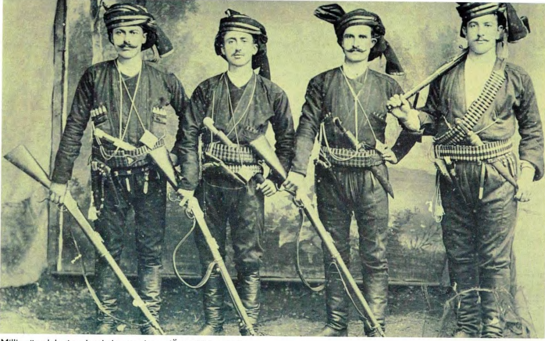
Millî mücadelenin adsız kahramanları...