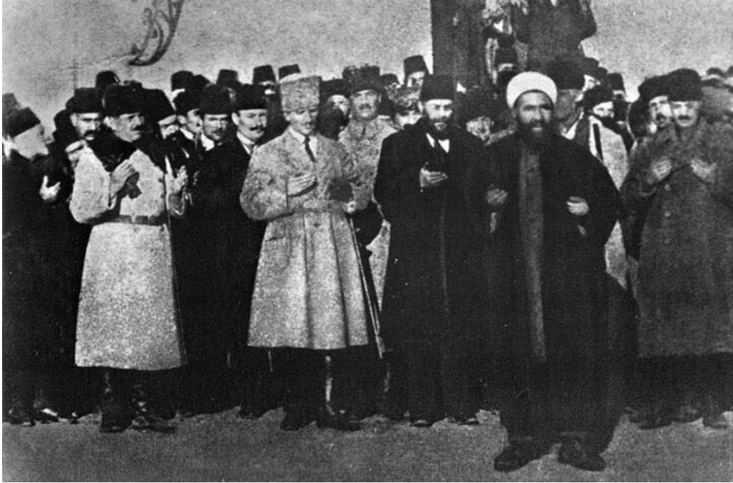
EK 5. Miralay Abidin Bey Oğlu Hakkı Paşa'nın Niğde Mebusu Olarak Ankara'da Türkiye Büyük Millet Meclisi'ne Gittiğine Dair Mülahazat.