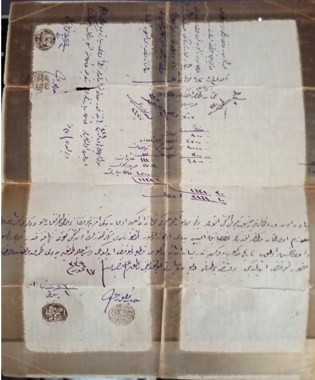
EK 1. O.M.Koğlu'nun Kafkas ve Afyon cepeleri görev ve terhis tahsisatını bildirir belge.