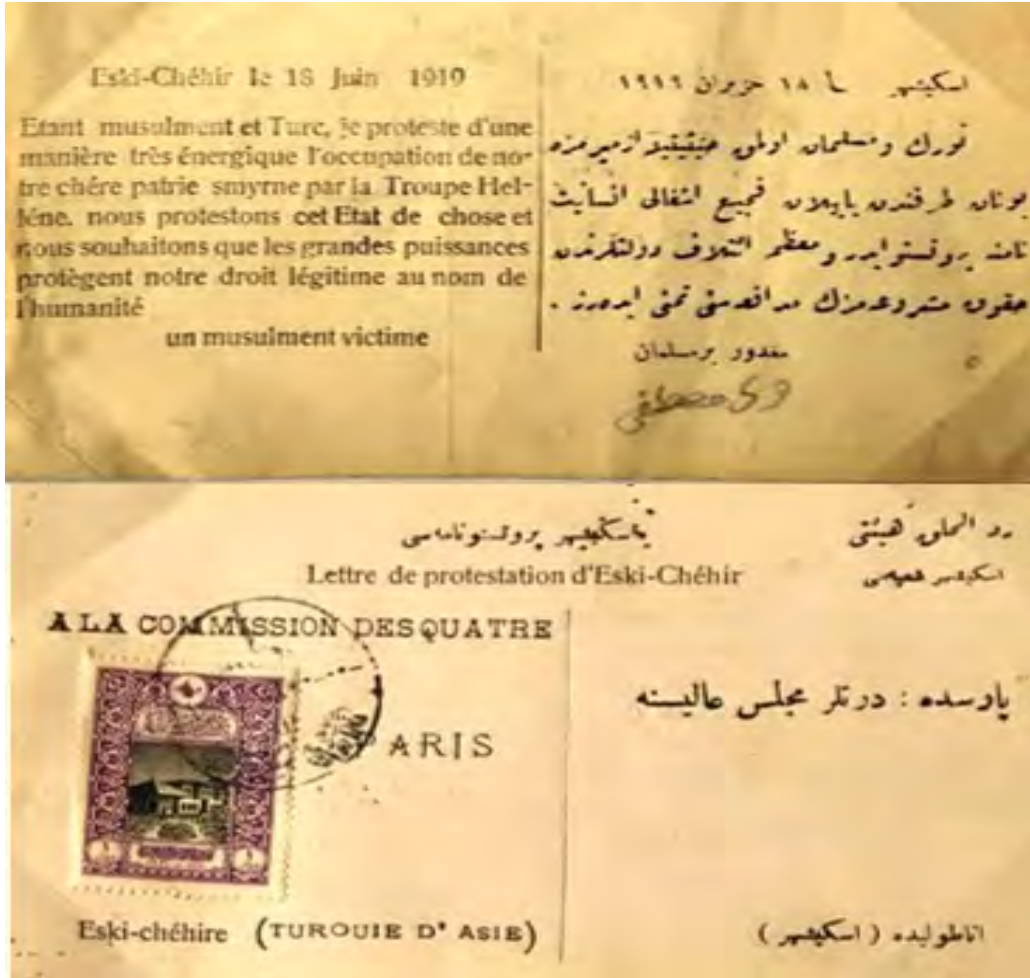
İzmir'in İşgali Üzerine Eskişehir'den Gönderilen Protesto Telgrafı 34