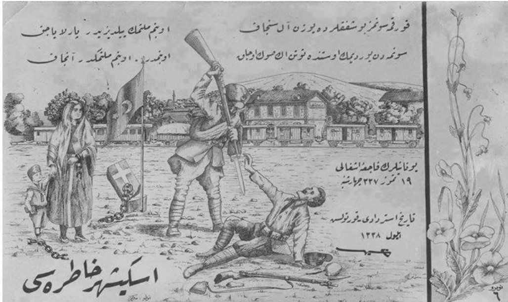
Eskişehir'in Düşman İşgalinden Kurtuluşunu Temsil Eden ve İstiklal Marşı'nın İlk Kıtasının Yer Aldığı Hatıra Kartpostalı 164

Eskişehir Mutasarrıflığı tarafından Dâhiliye Vekâleti'ne gönderilen Eylül 1922 tarihli raporlara göre Yunan askerlerinin kundaklamaları sonucu Tuz ve Tahıl Pazarı, Arifiye, Köprübaşı, İhsaniye mahalleleri tamamen, Sivrihisar Caddesi ve Hacı Alibey mahallesi kısmen ve sekizi Akarbaşı mahallesinden olmak üzere şehir merkezinde 2 bin ev, 1800 dükkân yakılmıştır. Bunlardan başka dördü un, biri yapağı ve biri de halı fabrikası olmak üzere 6 fabrika, 5 cami, 30 han ve otel, 2 hamam, Fransız, Alman ve Dursun Fakih Mektep ve Medresesi ile birlikte pek çok okul ve Porsuk çayı üzerindeki üç köprü ve istasyon bombalarla tahrip edilmiştir. 162 Öte yandan Yunan zulüm ve vahşeti kent merkezi ile sınırlı kalmamış, Mihaliççık, Seyitgazi, Sivrihisar ilçeleri ve köyleri de bu zulümden nasibini almıştır. Eskişehir Sancağı'nın ev ve ticaret eşyası, mücevherat, para ve her çeşit zahireye ait zayıatı, 19 milyon 813 bin 694 lira tutmuştur. Yalnız buğday, arpa ve saman zayıatı 9 milyon 220 bin 678 liradır. Her çeşit nakliye aracı ve hayvanların değeri ise 11 milyon 138 bin 12 liradır. 163