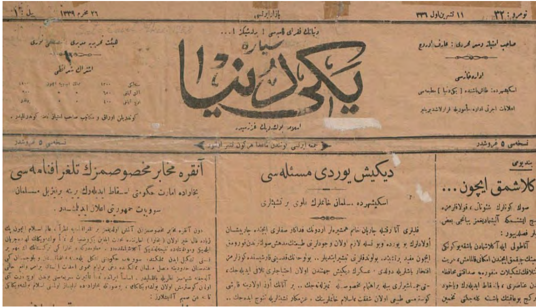
Eskişehir'de Yayınlanan Seyyare-i Yeni Dünya Gazetesi

Sükûnet döneminin bir başka gelişmesi Eskişehir'de İstiklal Mahkemesi'nin kurulmasıdır. Millî Mücadele döneminde asker kaçakları ile casusluk, bozgunculuk, vatana ihanet suçlarını yargılamak ve iç güvenliği sağlamak maksadıyla başlangıçta on dört bölgede kurulması teklif edilen İstiklal Mahkemeleri'nin sonradan sekiz bölgede kurulması kabul edilmiştir. Bu bölgeler ordunun desteklenmesi amacıyla kolordu kuruluşlarının yurt içindeki dağılışı dikkate alınarak tespit edilmiştir. Bunlar Ankara, Eskişehir, Kastamonu, Isparta, Konya, Diyarbakır, Sivas ve Pozantı'dır. 116