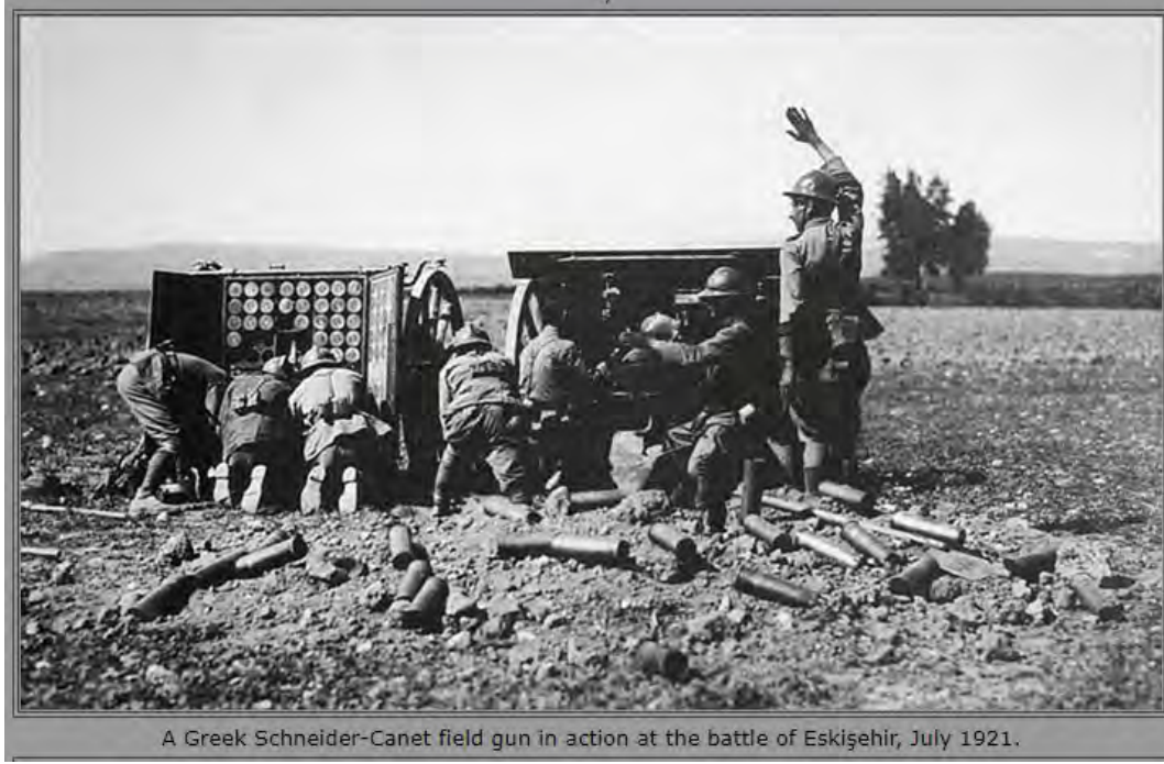
A Greek Schneider-Canet field gun in action at the battle of Eskişehir, July 1921.

artırılmasının faydalı olacağına karar vermiştir. Bu karar üzerine şehrin boşaltılmasına başlanmıştır. 129 Eskişehir'in kuzeyinde bulunan 3. Yunan Kolordusu çekilen Türk kuvvetlerinin ardından 19 Temmuz 1921 Çarşamba günü Eskişehir'e girmiştir. 130