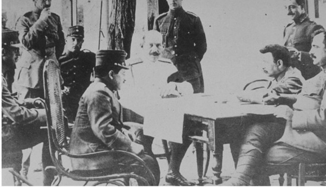
Yunan Kralı Konstantin Kurmaylarıyla Eskişehir'de

Sonuçta Türk ordusu Sakarya'ya doğru çekilmek zorunda kaldı. Şerif Güralp'in ifadesiyle "Eskişehir Muharebesini de Eskişehir Vilayeti ile beraber kaybetmiş olduk." 136 Eskişehir'in işgalinin hemen sonrasında 22 Temmuz'da Yunan Kralı Konstantin maiyetiyle birlikte Eskişehir'e geldi. 137