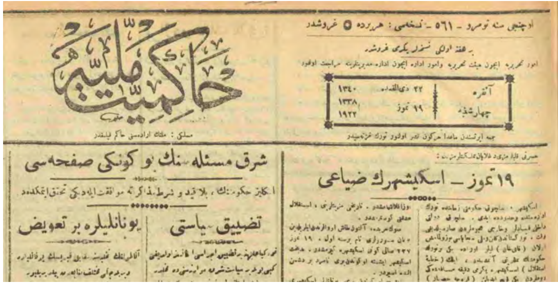
19 Temmuz, Eskişehir'in Ziyâ