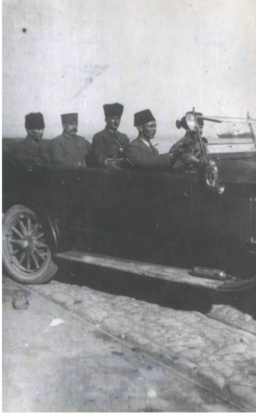
EK 4. Zaferden sonra Bergama'da, 2. Kolordu karargahı önünde