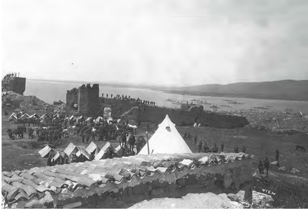
EK 8. İzmir'in İşgalden Kurtuluş Hatırası (Güzel İzmirimizin Yunanlılardan Tathiri) (Türk Tarih Kurumu Arşivi, OFS Koleksiyonu, Dosya 14, No 93)