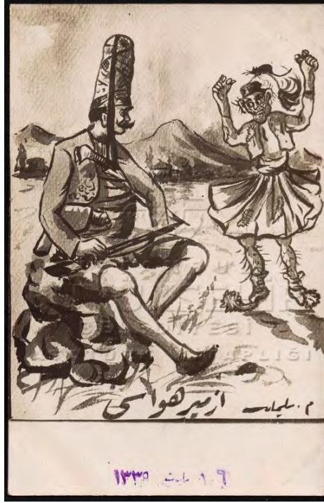
EK 11. İzmir'imizi düşmanın din ve milletin dest-i mülevvesinden kurtararak bu kıymetdar beldemize ilk süvarimiz şanlı sancağımızla dâhil olurken (İstanbul Büyükşehir Belediyesi Atatürk Kitaplığı, Krt_026824)