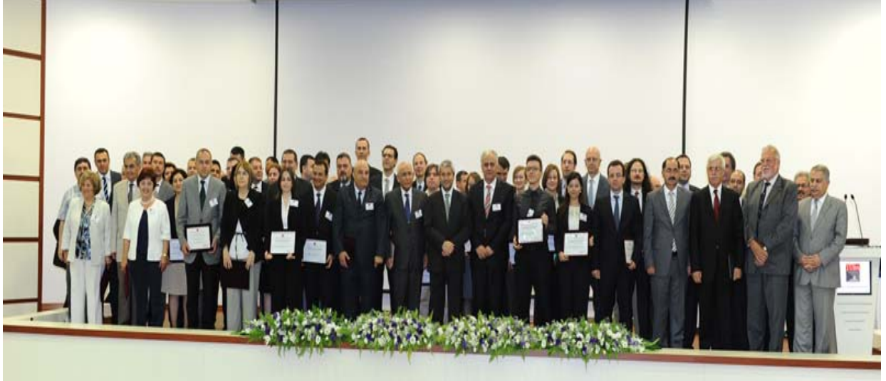
“Türkiye Bilimler Akademisi 08 Haziran 2013 tarihli GEBİP ve TEÇEP Ödül Töreni”

Değerlendirme Komitesi Başkanlarının katıldığı Üst Kurul, komisyon raporlarının toplu değerlendirmesini yapacak ve Akademi Konseyi'ne sunulmak üzere bir rapor hazırlanacaktır. Son olarak, Akademi Konseyi, kaç esere ödül, kaç esere ise mansiyon verilmesine karar verecektir. Önceki ödül uygulamalarında olduğu gibi, ödül alan eserler Akademimiz ağ sayfasında ilan edilecek ve ödül töreni düzenlenecektir.